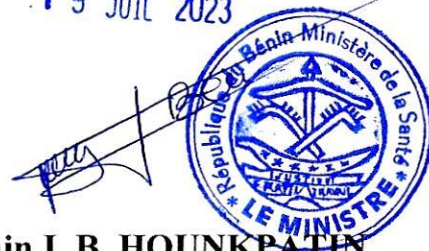
Benjamin I. B. HOUNKPATIN Ministre de la Santé